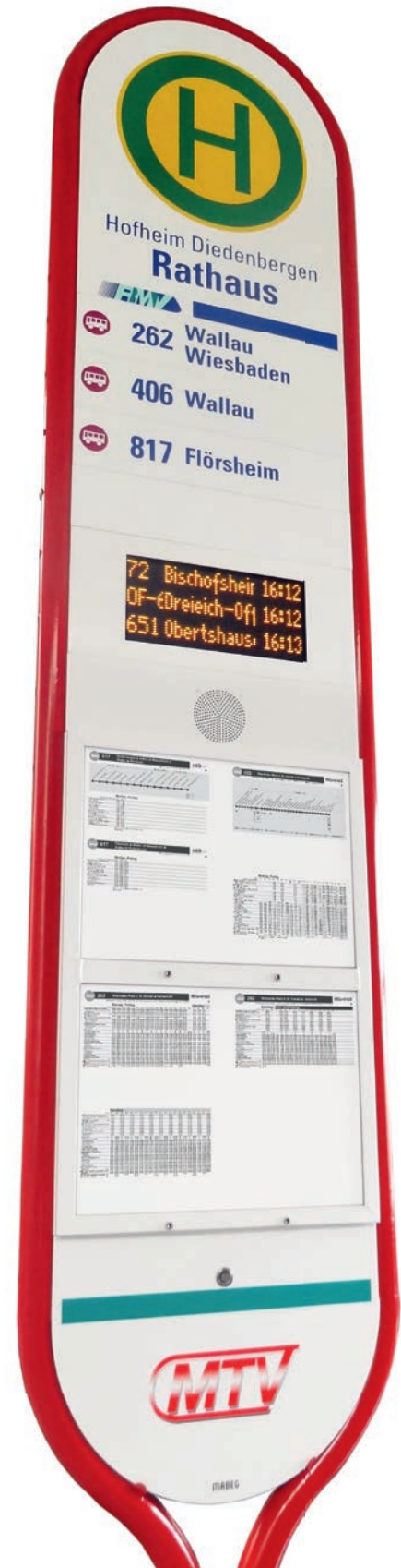
▲ Beispielhafte Ausstattung einer FIS ® 2 Stele mit integriertem DFI Modul.