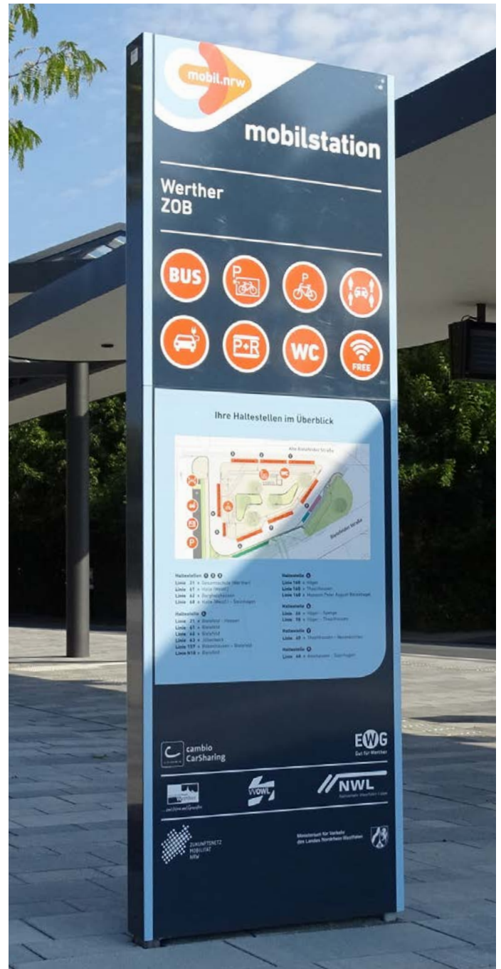
FIS 6-N als mobil.nrw Stele mit Übersichtsplan am ZOB Werther