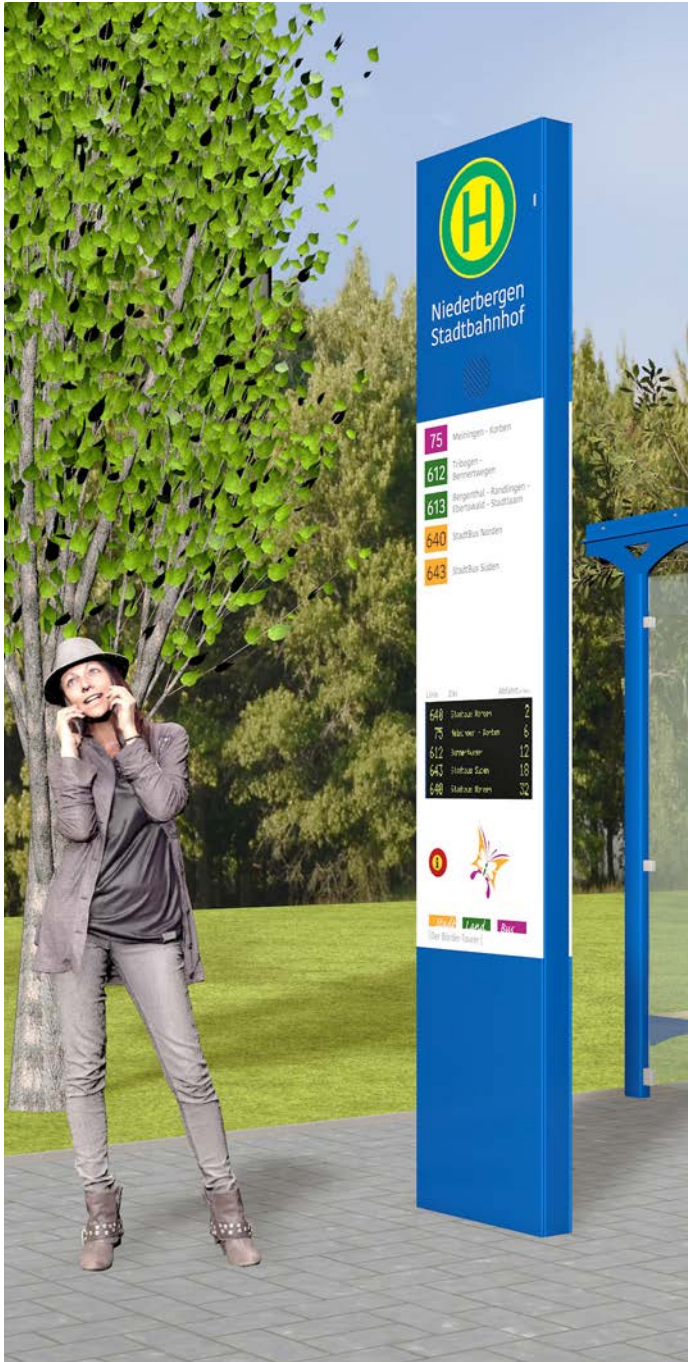
Kombination mit statischer und dynamischer Information