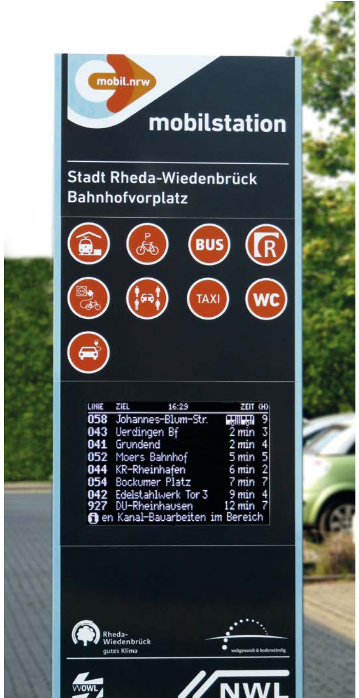
Einbaubeispiel LED-Anzeige Fa. Lumino (Krefeld) in FIS 6-N