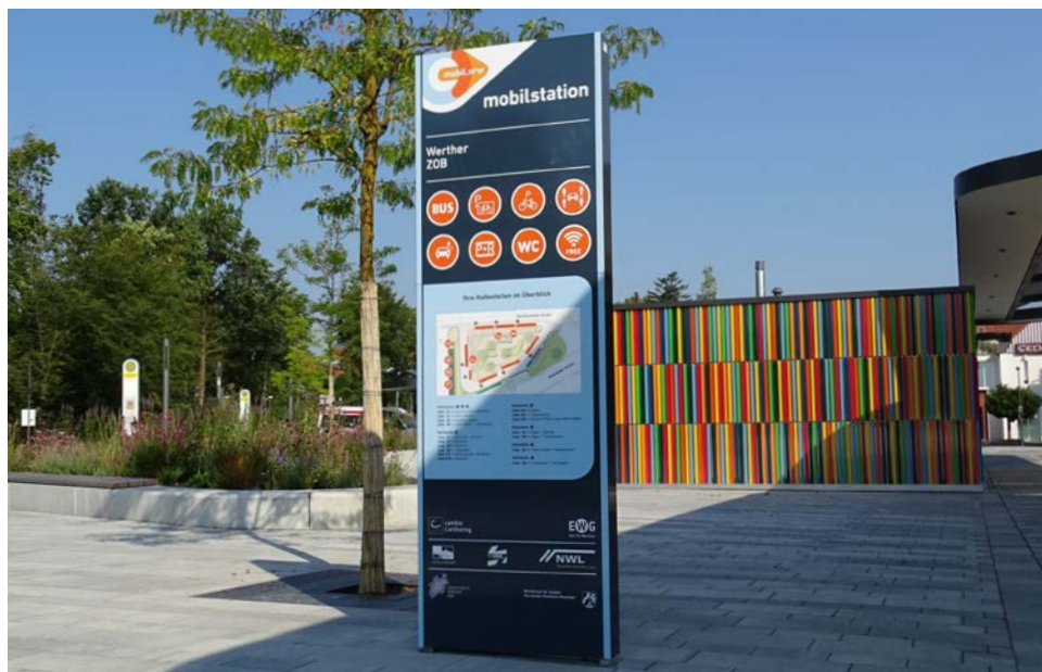
FIS 6-N die flexible Informationsstele