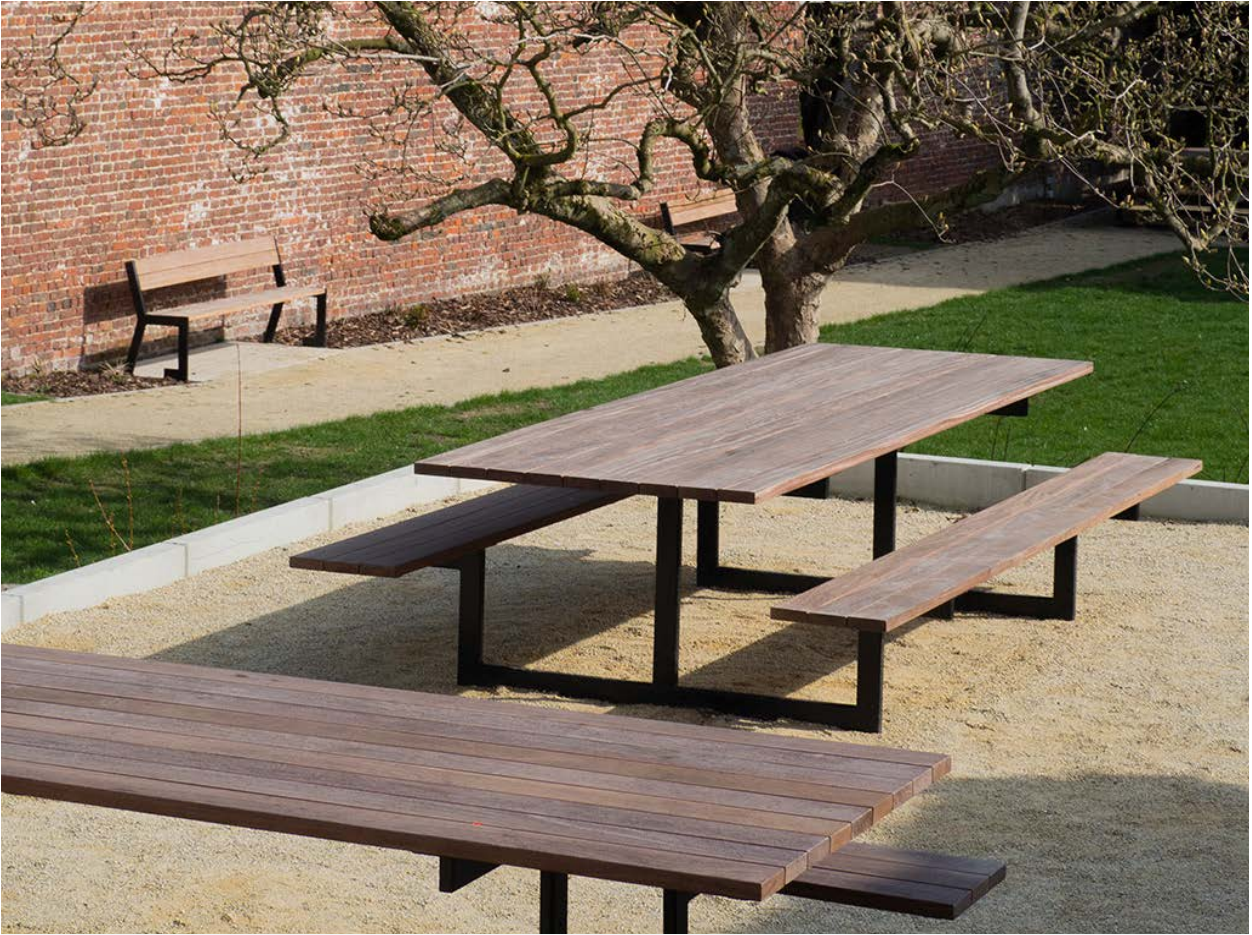
FOREST Picknick Frontansicht