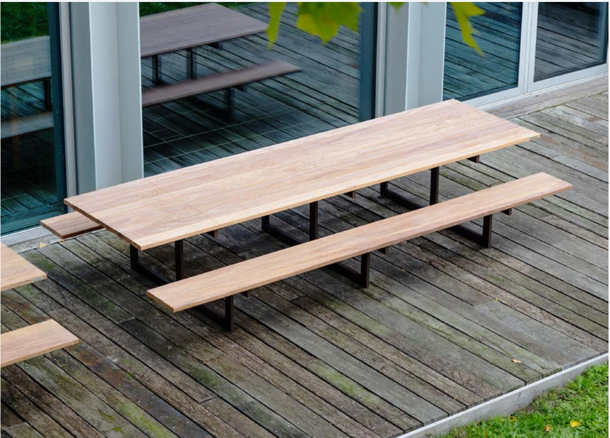
FOREST Picknick mit Hockerbänken