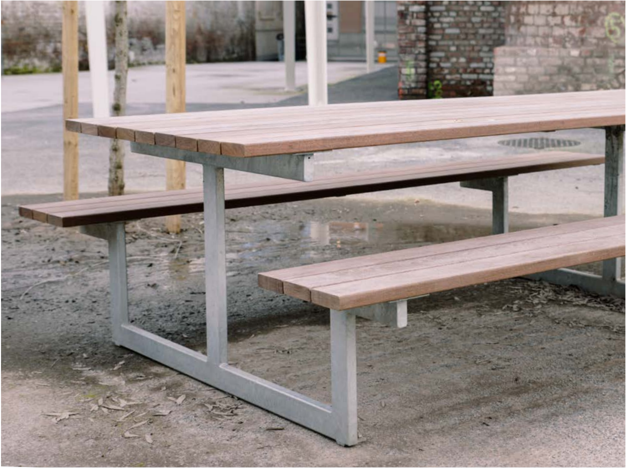
FOREST Picknick bestehend aus einem Tisch und zwei Sitzbänken