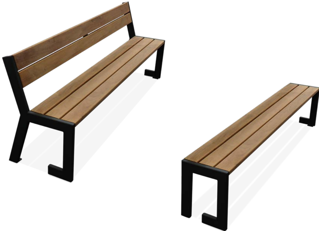
FOREST als Sitzbank mit Rückenlehne oder als Hockerbank