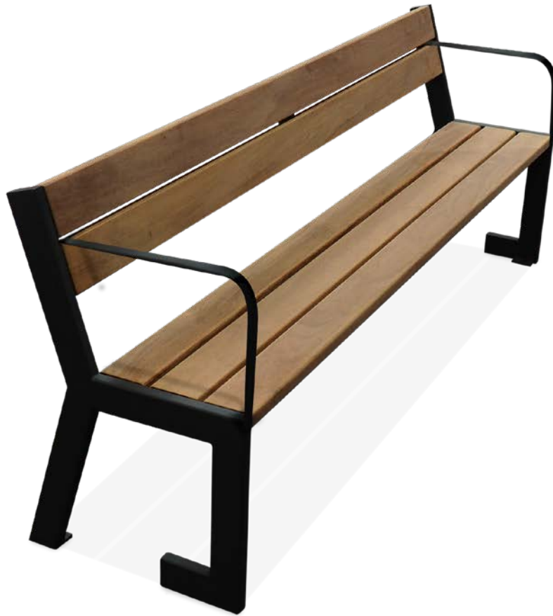
FOREST mit Arlehne