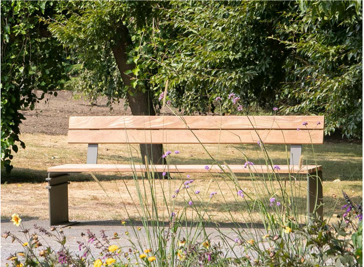
Sitzbank LINA mit Sitz- und Rückenflächen aus FSC zertifizierten Holzlaten