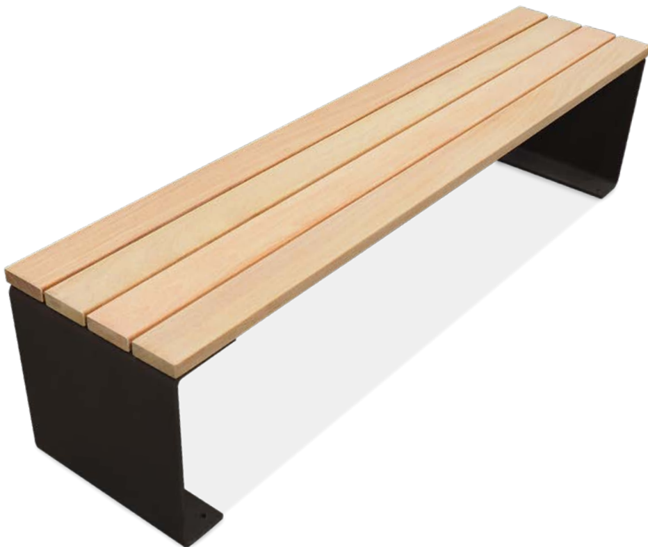
Sitzbank LINA Hockerbank