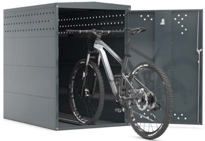
▲ Einzelgarage M1

Optimaler Schutz für Fahrrad und Gepäck bei jeder Witterung. Robuste Stahlblech-Konstruktion, korrosionsgeschützt durch Feuerverzinkung und hochwertiger Pulverbeschichtung. Einfaches Einstellen des Rades durch Führungsschiene. Die Lieferung erfolgt in zerlegtem Zustand. Montagematerial und -anleitung im Lieferumfang enthalten.