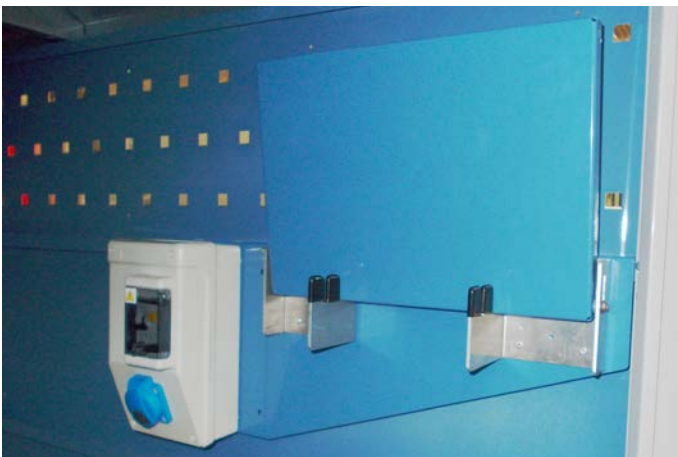
▲ Ladevorrichtung für Pedelecs an Gehäusewand montiert