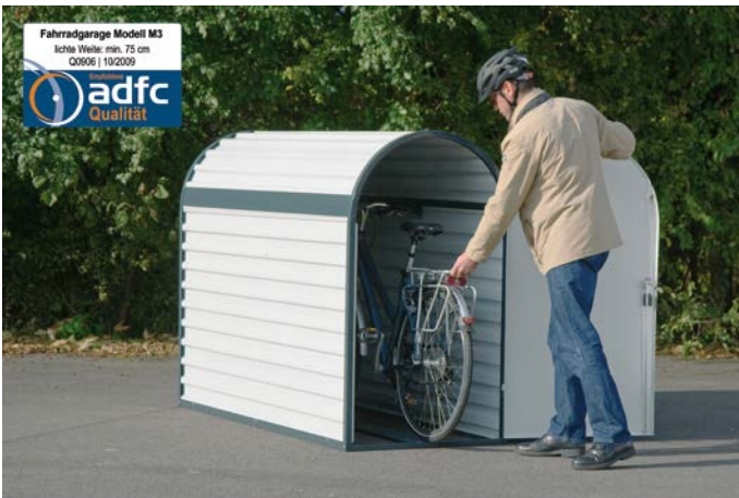
▲ einfaches Einstellen durch Führungsschiene