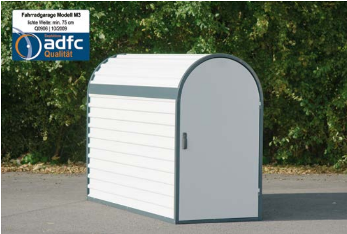
▲ Einzelgarage M3