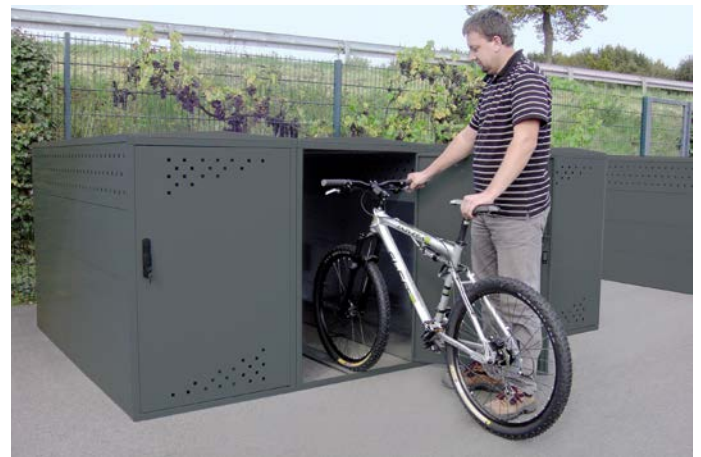
▲ M1 mit Erweiterungsmodul M1.1 mit Seitenwand

(nur in Verbindung mit Grundmodul M1 zu verwenden) sonst Ausführung wie Modell M1