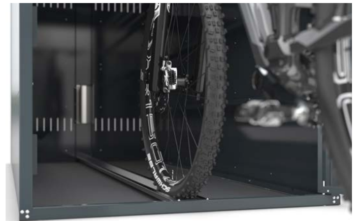
▲ M1 Detail Führungsschiene