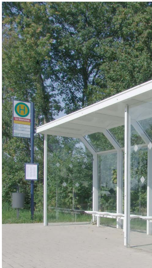
▲ WH A 5-feldrig mit Drahtgittersitzen und 2-feldriger Windschutzwand

► Ihren Ansprechpartner für weitere Informationen zu diesem System finden Sie auf der Rückseite.