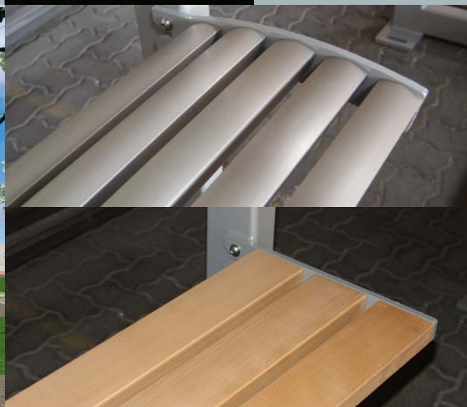
▲ Sitzausführungen in Holzlattung oder Aluminiumprofilen (eloxiert und gebürstet)