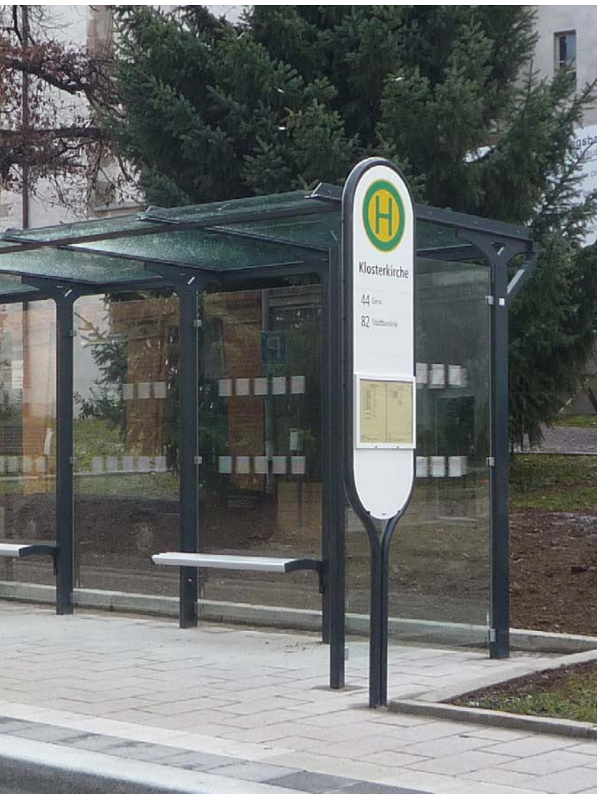
▲ 5-Feld Wartehalle mit ganzer Seitenwand und Sitzbänken aus Aluminiumprofilen