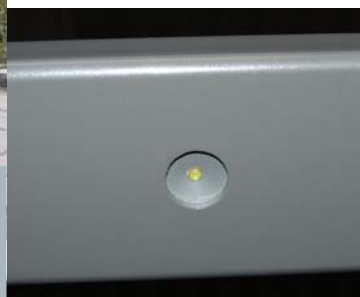
◀ Unterzug mit LED Beleuchtung

in verschiedenen Formen und Ausführungen