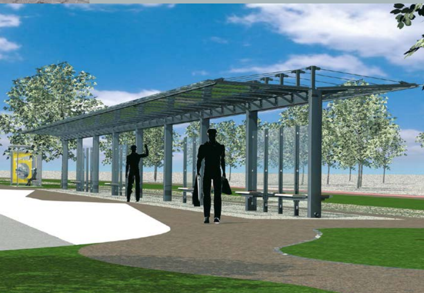
▲ Wartehalle F doppelzeilig mit Windschutzwänden ◀ Aufstellung in polygoner Form