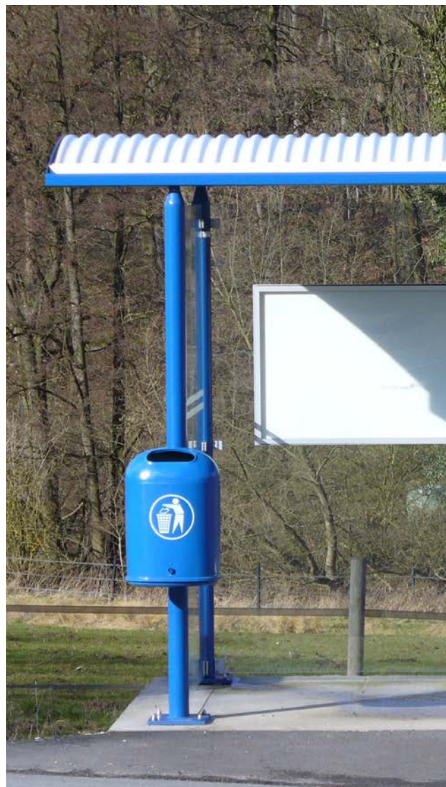
▲ Wartehalle H mit Sitzbank Typ H, Abfallbehälter A 300 und Fahrplanvitrine

Zusätzlich kann die Wartehalle natürlich mit Zusatzkomponenten wie Vitrinen oder Abfallbehälter ergänzt werden.