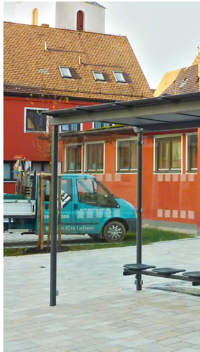
▲ WH X 3-feldrig mit Drahtgittersitzen und ganzer Seitenwand

*) Achtung: Ab einer Bautiefe von 2.250 mm oder 2.500 mm nur mit einer Seitenwand von 1.560 mm möglich!