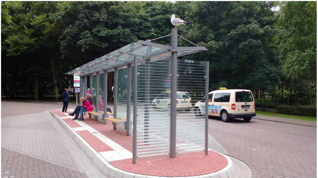
Windschutzwände am Ende der doppelzeiligen Überdachung System O