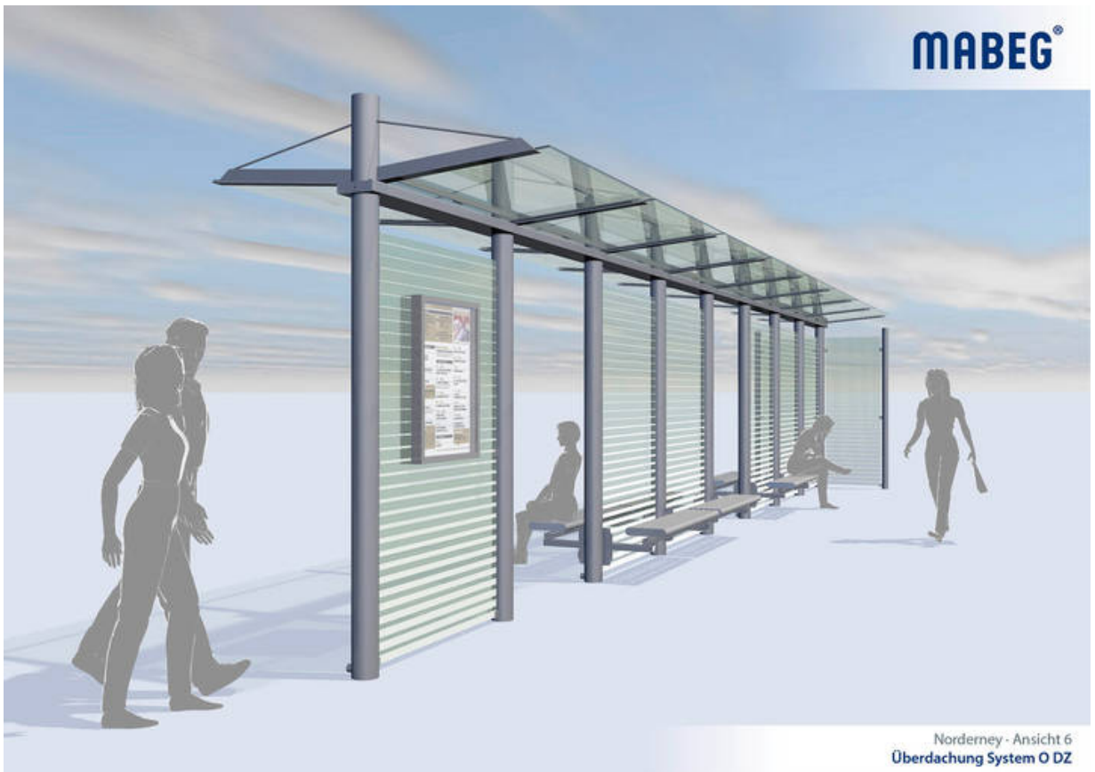
Präsentationsmuster einer doppelzeiligen Überdachung System O für Norderney