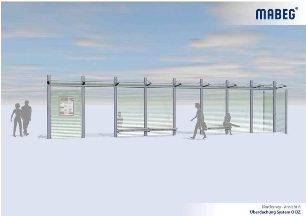
Seitenansicht der kundenspezifischen Wartehalle System O für Norderney