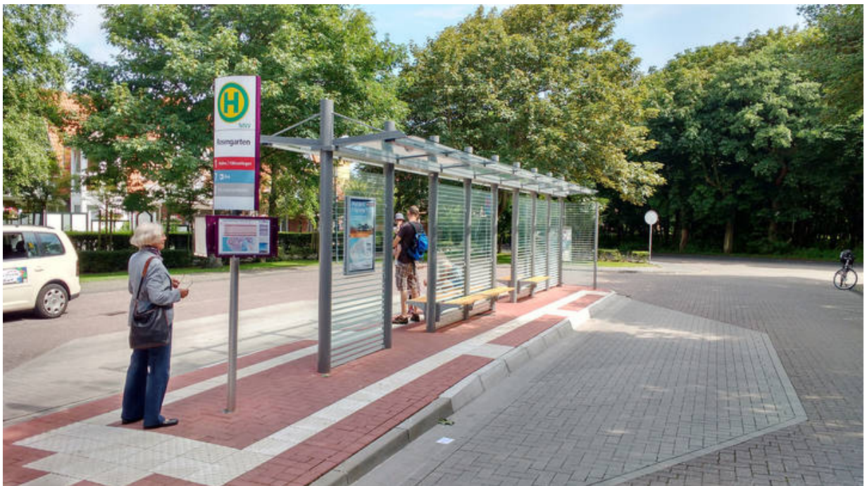
Doppelzeilige Wartehalle System O mit Infovitrine im ersten Trennwandelement