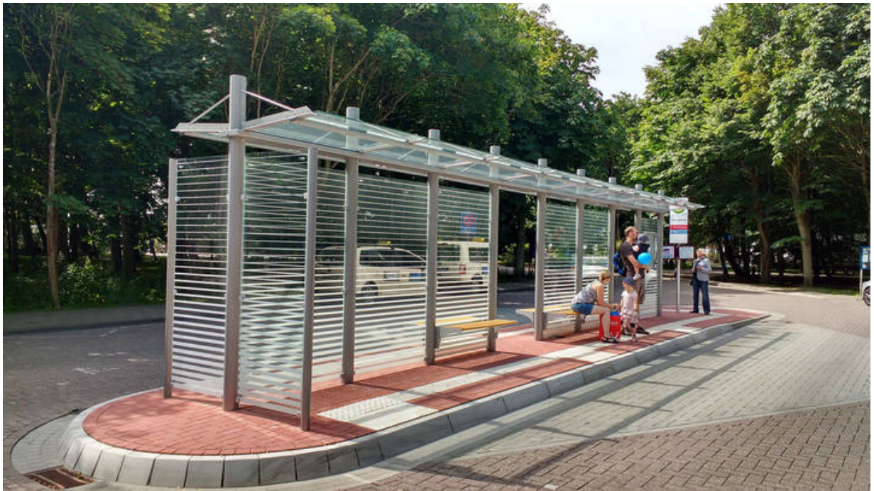
Doppelzeilige Wartehalle System O am Busbahnhof Rosengarten auf Norderney