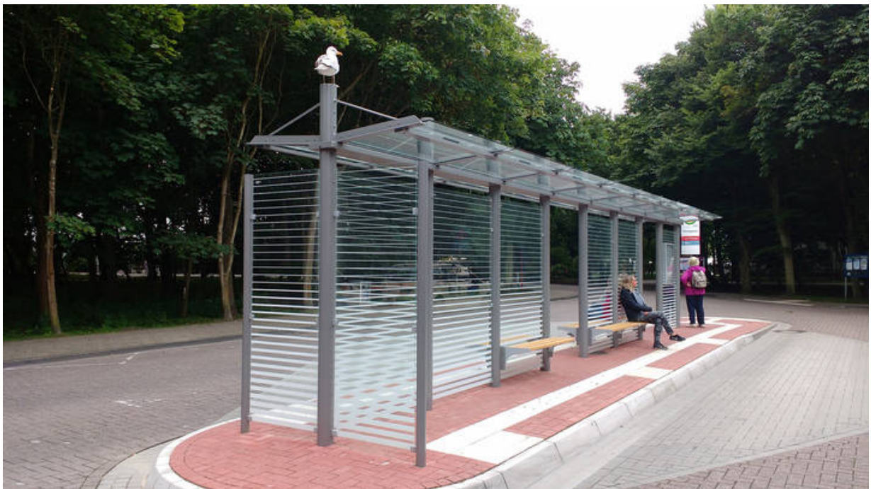
Doppelzeilige Wartehalle System O am Busbahnhof Rosengarten auf Norderney

Neue Überdachung System O für die Warteinsel am Busbahnhof Rosengarten