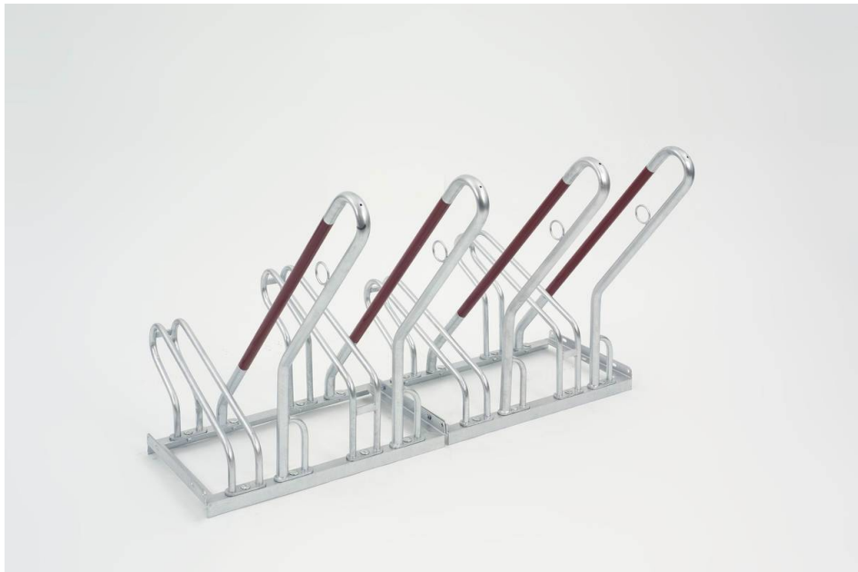
Anlehnparker M-250 Einstellung