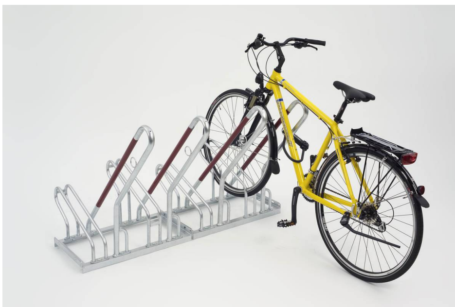
Anlehnpark M-250 Einstellung Hoch

moderner Fahrradparker mit funktionellen Anlehnbügel