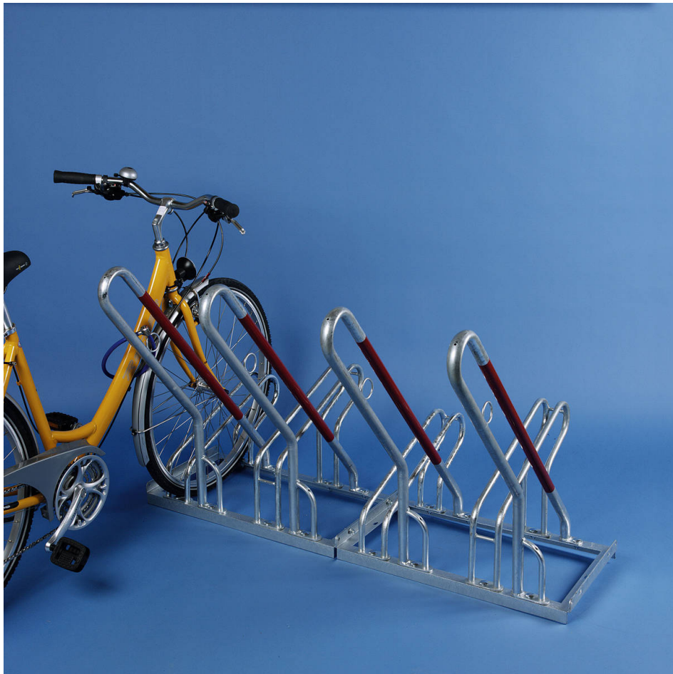
Anlehnparker M-250 Einstellung Tief