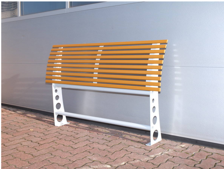
Anlehnstützbank LEAN mit dekorativen Seitenelementen