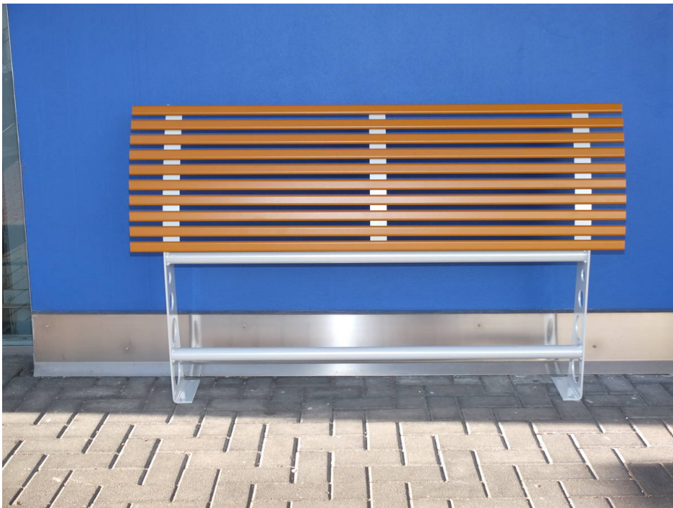
Frontansicht Anlehnst tzbank LEAN