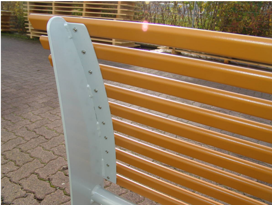
Rückseite Anlehnstützbank LEAN