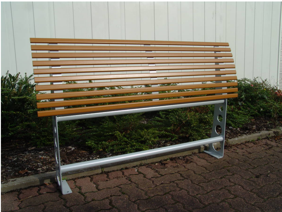
Anlehnstützbank LEAN mit Fußstütze