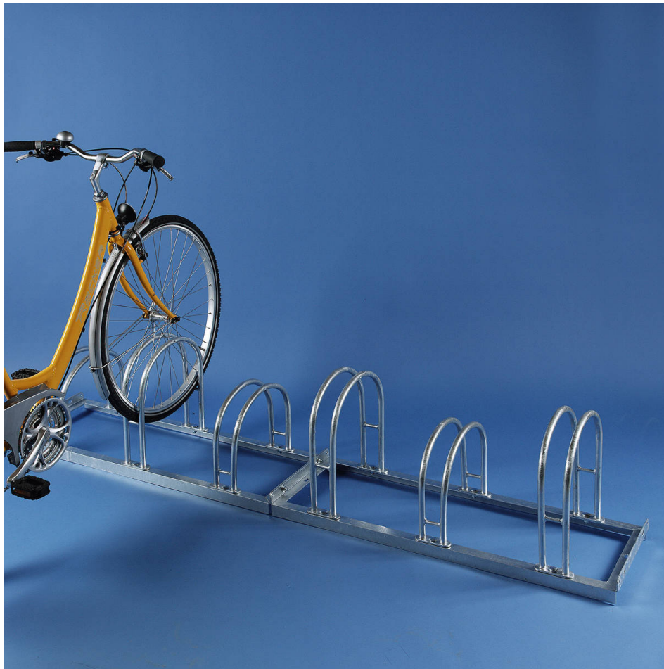
Bogenparker M-500 Einstellung Hoch