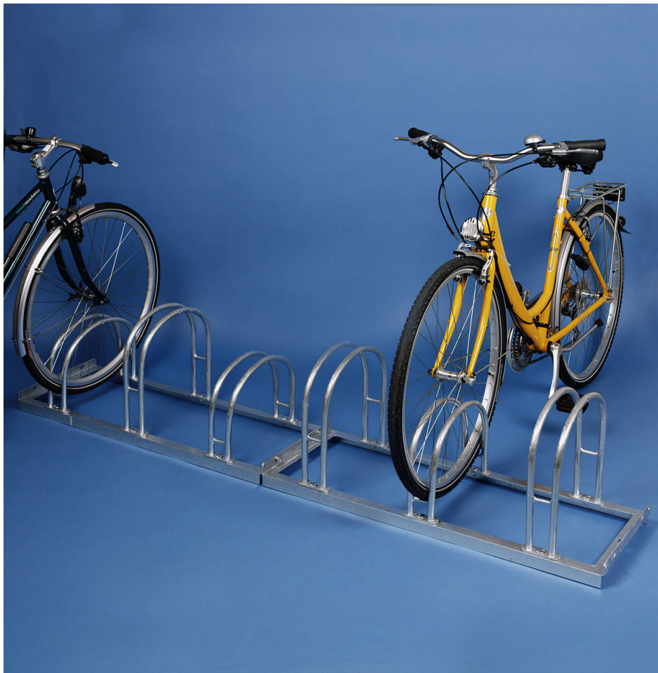
Bogenparker M-500 Einstellung Hoch und Tief