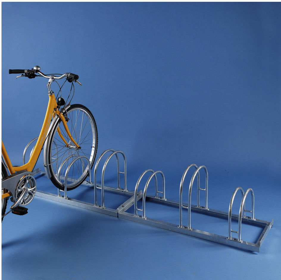
Bogenparker M-500 Einstellung Tief