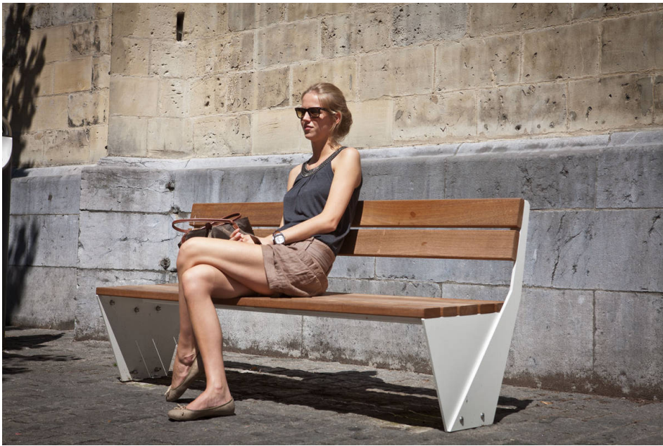
Sitzbank ENSEMBLE mit Sitz- und Rückenfläche aus Holz