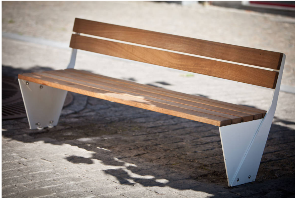
Sitzbank ENSEMBLE mit Sitz- und Rückenfläche aus Holz