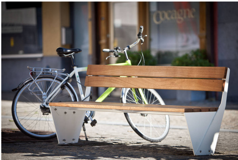
Sitzbank ENSEMBLE mit Sitz- und Rückenfläche aus Holz