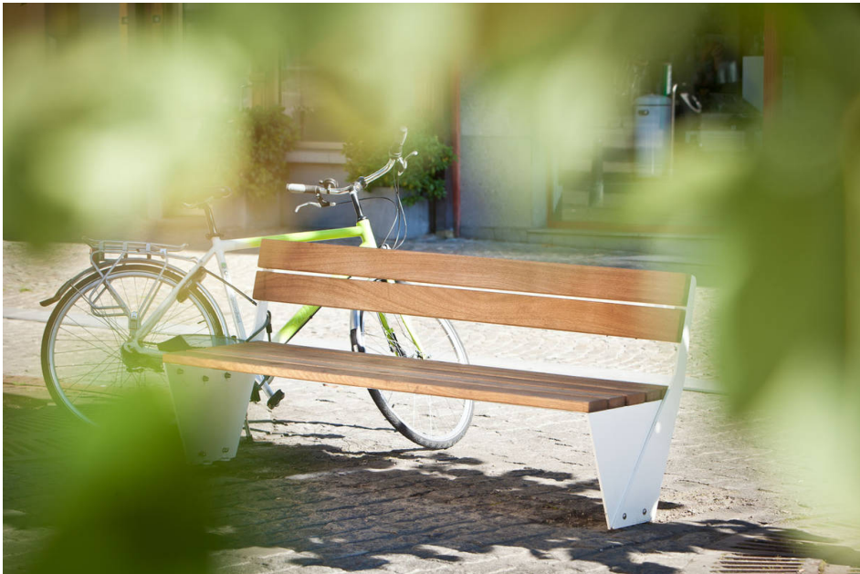
Sitzbank ENSEMBLE mit Rückenlehne