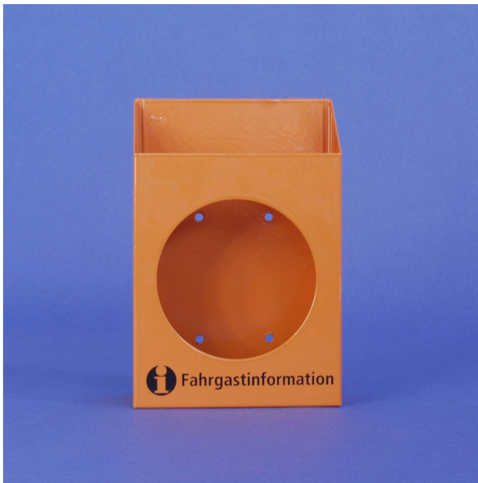
Standard-Behälter für Fahrgastinformationen