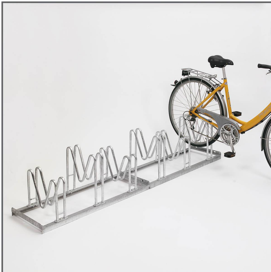
Multiparker M-800 Einstellung Tief

Schonend für Achsen, Speichen und Scheibenbremsen