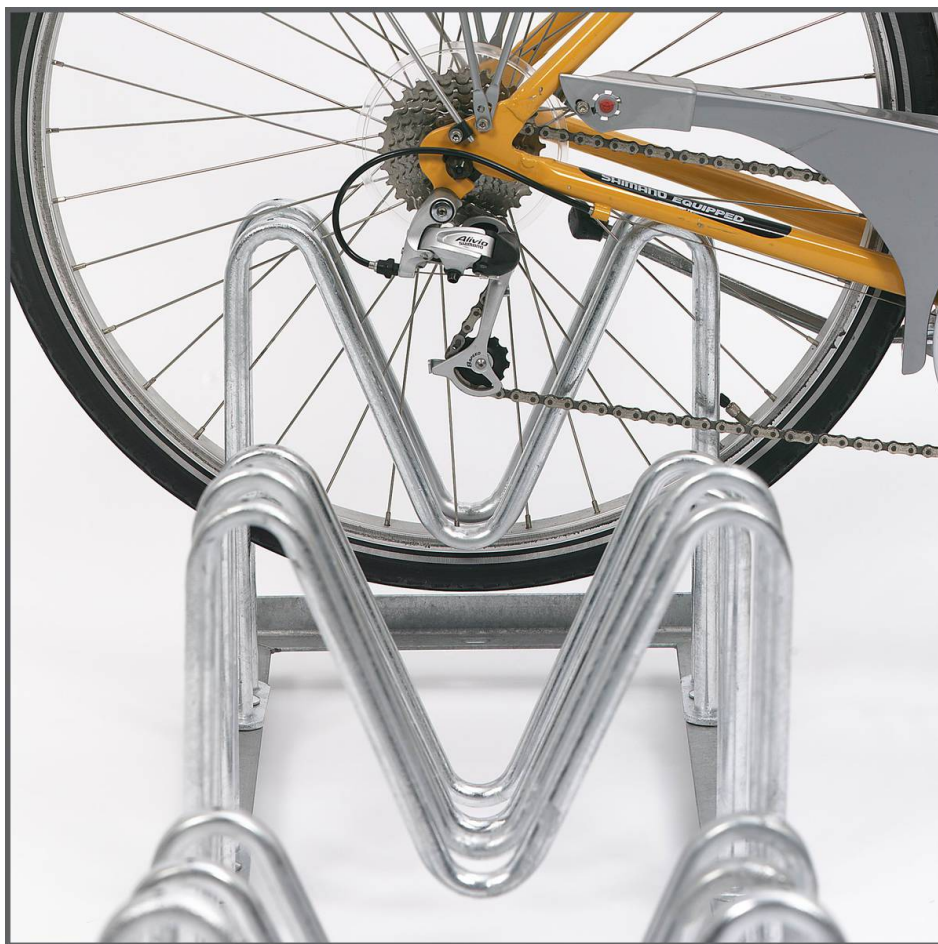
Multiparker M-800 Detail Einstellung Hinterrad