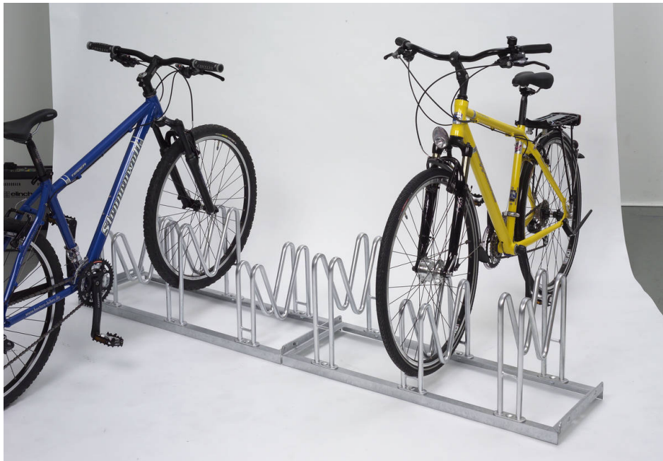
Multiparker M-800 Einstellung Beidseitig