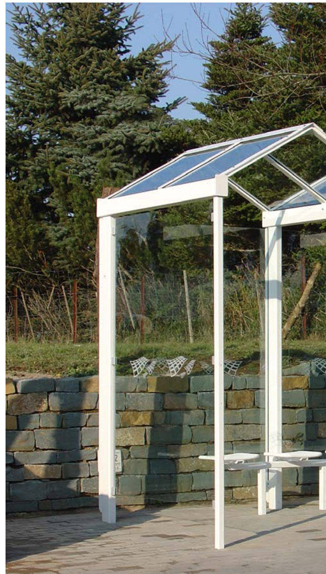
▲ Wartehalle G mit Fahrplanvitrine und 3-Sitzer Drahtgittersitzbank

(Optional photovoltaisch versorgt, Solaraufsatz auf dem Dach zur flexiblen Ausrichtung, Betätigung über Bewegungsmelder)